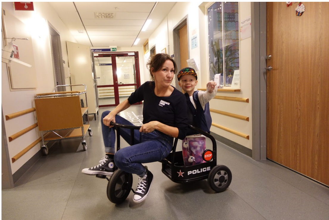
Kanslipersonal agerar taxi på Barncancercentrum i Umeå.

En viktig del i verksamheten är stödet till de barn och familjer som ligger inne på sjukhus. Ingen ska känna sig ensam vid ett cancerbesked. Alla barncancerföreningar, inklusive Barncancerfonden Norra, delar ut en ryggsäck med åldersanpassat innehåll till alla nyinsjuknade barn och deras syskon. I ryggsäcken finns även information till vårdnadshavare om det stöd som föreningen ger. Alla barn och ungdomar som insjuknar erbjuds även ett Supersnöre som hjälper barnet att bearbeta sin sjukdom. Supersnöret är ett snöre med pärlor, där varje pärla symboliserar en del i behandlingen.