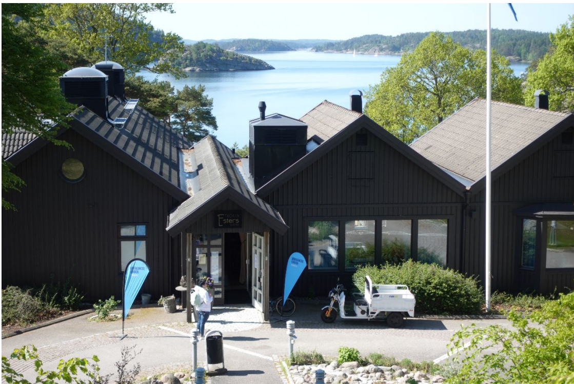
Årets Ungdomsstorläger genomfördes på Bokenäset utanför Uddevalla.