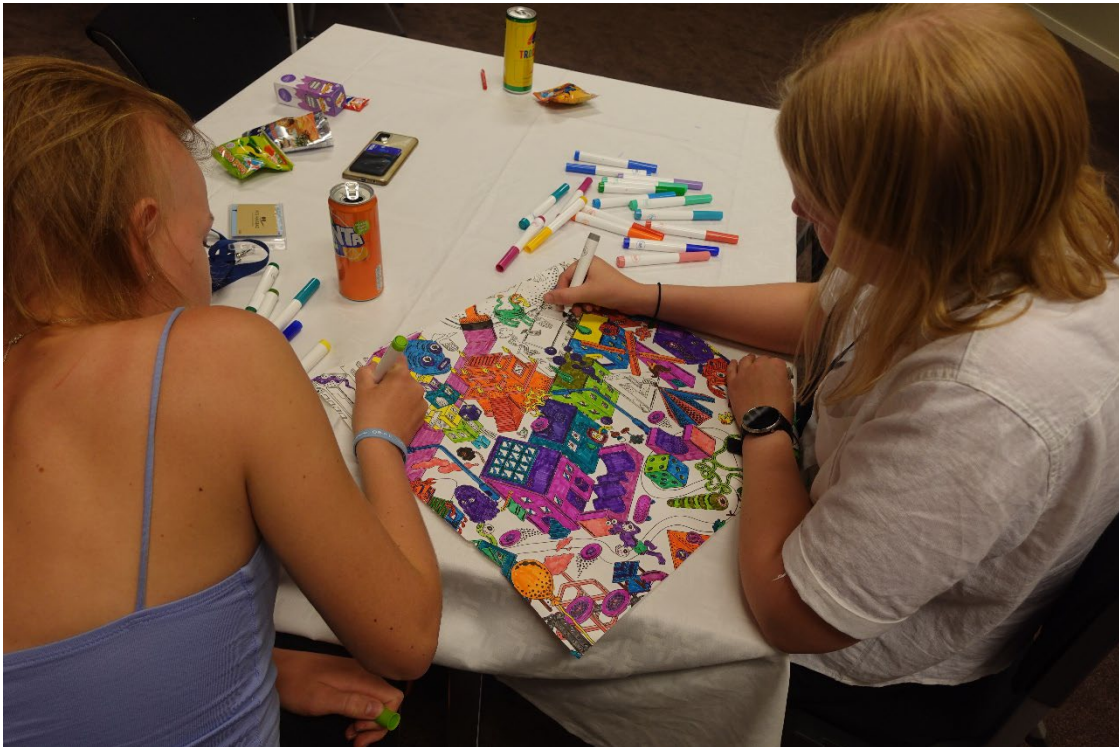
Ett kärt återseende på familjehelgen i Piteå.