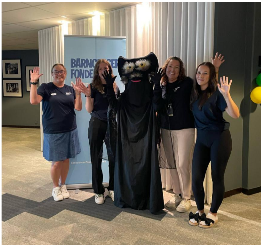
Volontärgänget på familjehelgen Södra berget 2025

Föreningen satsar extra på att visa tacksamhet och uppmuntran för det ideella engagemanget som volontärerna bidrar med. Vid terminsstart i januari och augusti har kick-off för volontärerna genomförts.