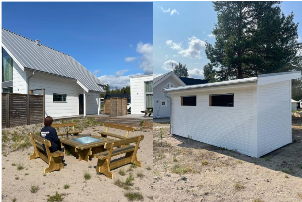
T.v Nya grillplatsen. T.h Nybyggda cykelförrådet.

Under 2025 byggde vi ett nytt cykelförråd och en gemensam grillplats för Lyckebo.