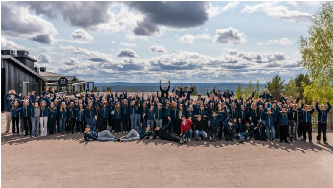
Gruppbild från Ungdomsstöreläret som genomfördes på Idre Fjäll.

syskonstödjare, en volontär och en styrelsesuppleant. Norra föreningens koordinators var också på plats tillsammans med personal från riksförbundet och de andra föreningarna.