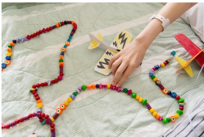
SuperSnöret, där varje pärla symboliserar en del i barnets behandling.

En viktig del i verksamheten är stödet till de barn och familjer som ligger inne på sjukhus. Ingen ska känna sig ensam vid ett cancerbesked. Alla barncancerföreningar, inklusive Barncancerfonden Norra, delar ut en ryggsäck med åldersanpassat innehåll till alla nyinsjuknade barn och deras syskon. I ryggsäcken finns även information till vårdnadshavare om det stöd som föreningen erbjuder. Alla barn och ungdomar som insjuknar erbjuds även ett SuperSnöre som hjälper barnet att bearbeta sin sjukdom. SuperSnöret är ett snöre med pärlor, där varje pärla symboliserar en del i cancerbehandlingen.