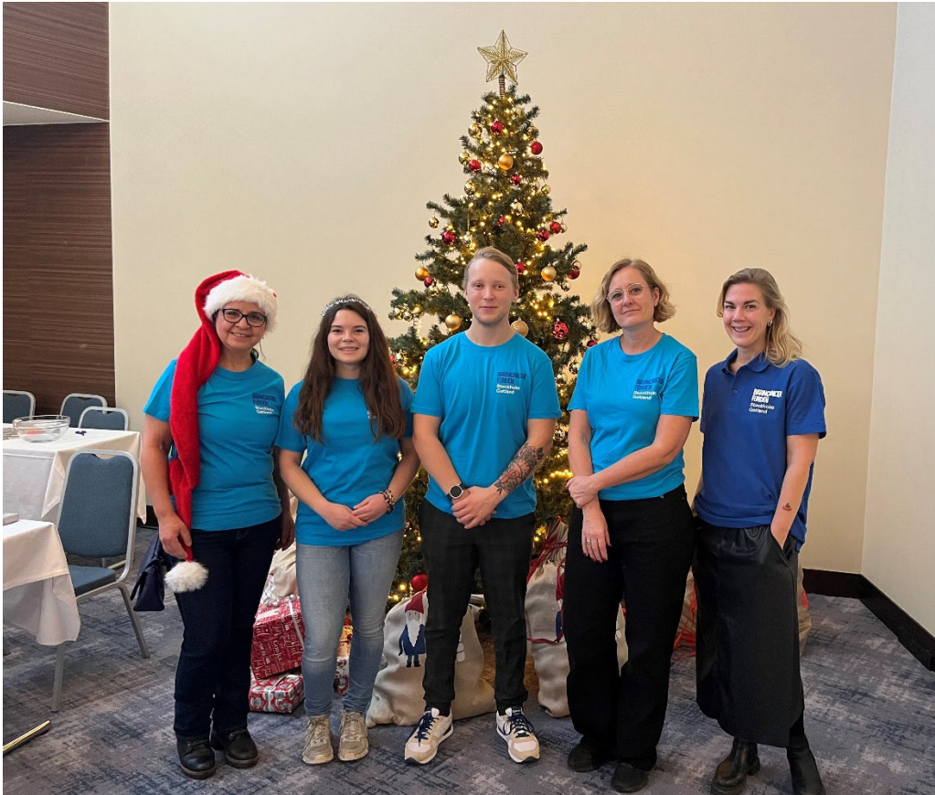
Volontärer och kanslipersonal på julfesten.

Föreningens arbete bygger på ideella arbetsinsatser för stödaktiviteter, gemenskap och erfarenhetsutbyte. Totalt har omkring 30 personer varit ideellt engagerade i olika delar av verksamheten.